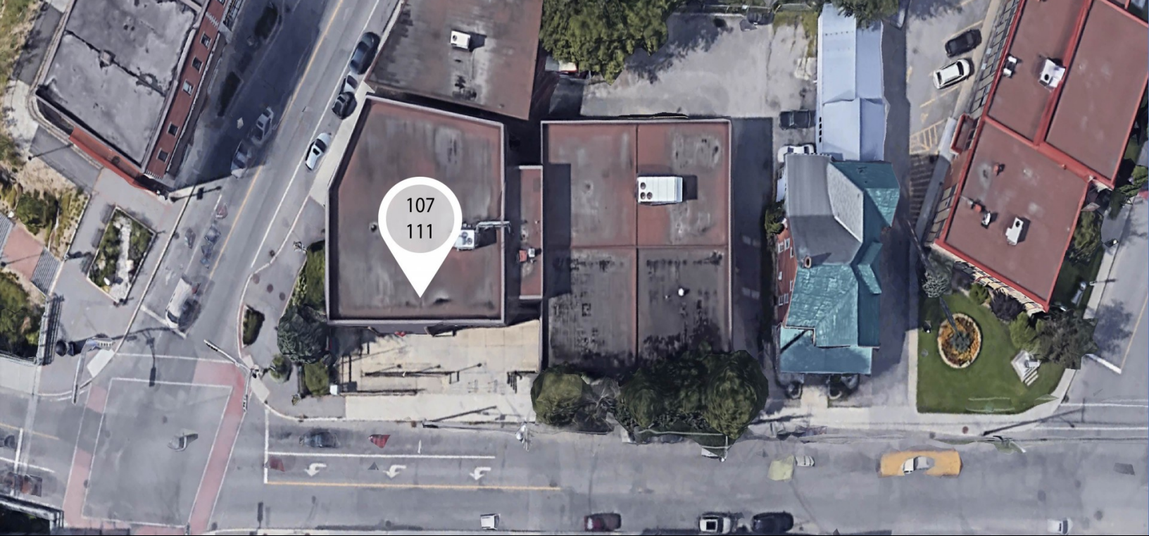
107-111 Maclaren E, Buckingham