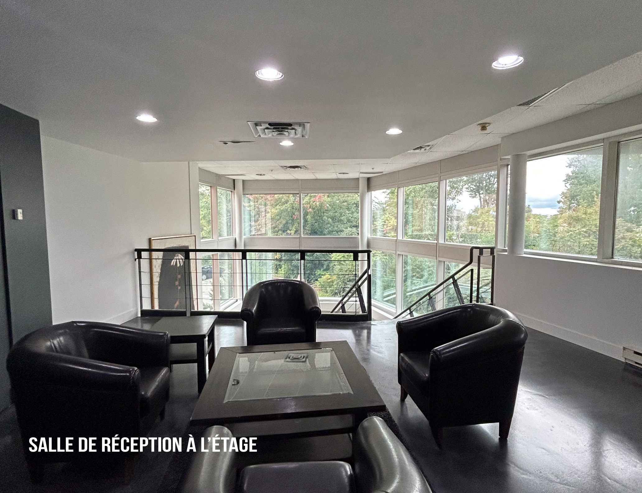
SALLE DE RÉCEPTION À L'ÉTAGE